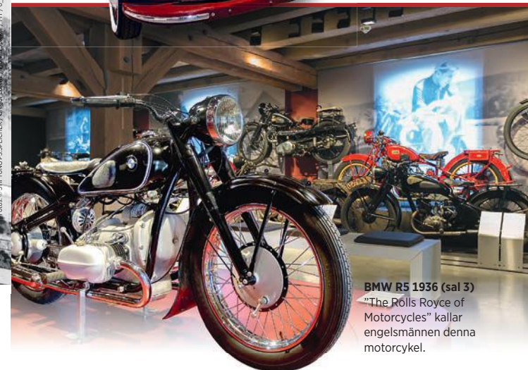
BMW R5 1936 (sal 3) "The Rolls Royce of Motorcycles" kallar engelsmännen denna motorcykel.