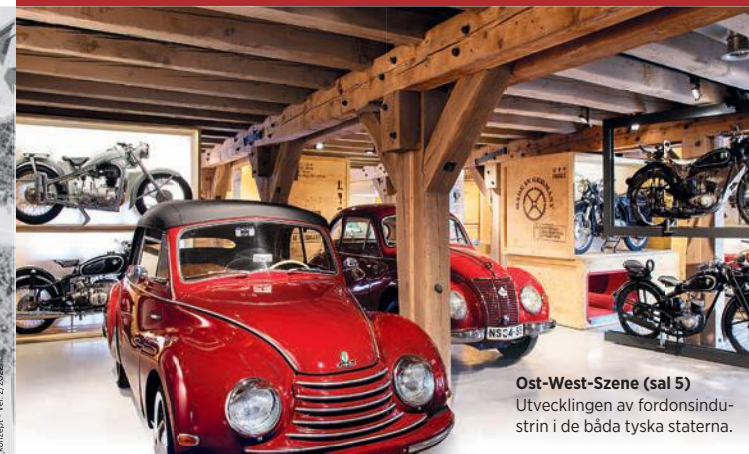
Ost-West-Szene (sal 5) Utvecklingen av fordonsindustrin i de båda tyska staterna.

Unika historiska motorcyklar och bilar väntar på att bli upptäckta av dig. Res tillbaka till det "gyllene tjugotalet" i en Hanomag Kommissbrot eller sätt dig i en typisk