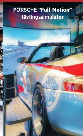
PORSCHE "Full-Motion" tävlingssimulator