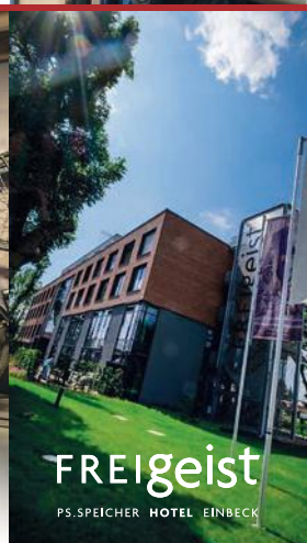
FREIGEIST PS.SPEICHER HOTEL EINBECK

Öppettider på sommaren (april-oktober) Tis.-sön. 10:00 till 18:00 Mån. stängt Öppet på helgdagar (även måndagar)